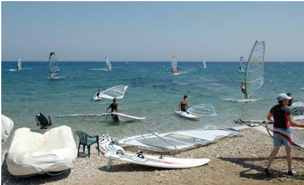
Uscita davanti al surfcenter