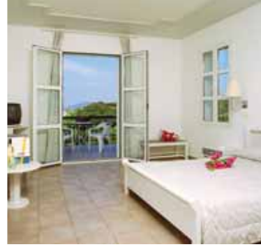
Camera Hotel Arion