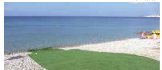
Tappeto verde per rendere l'uscita più comoda