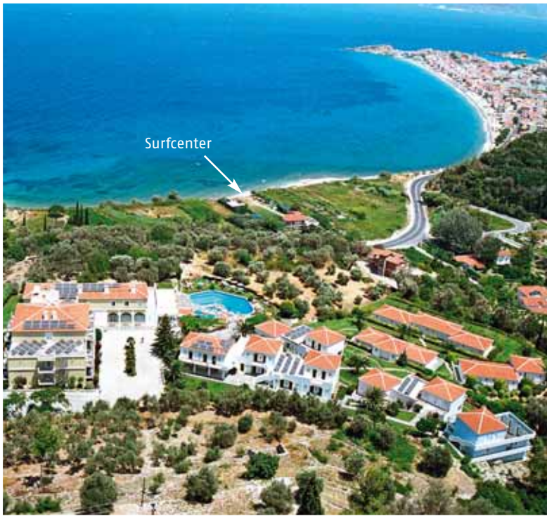
Hotel Arion e vista sul surfcenter