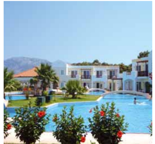
Deluxe App. Marmari Beach

Sport e Divertimento: l'hotel offre una grande scelta di attività sportive con e senza pagamento.