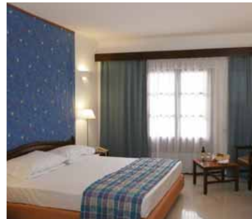
Camera hotel Oceanis