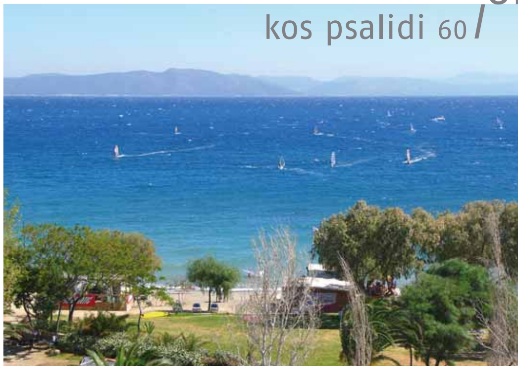
Vista dall'hotel Oceanis sul surfcenter