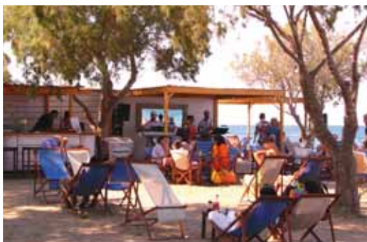
Beachbar presso il surfcenter