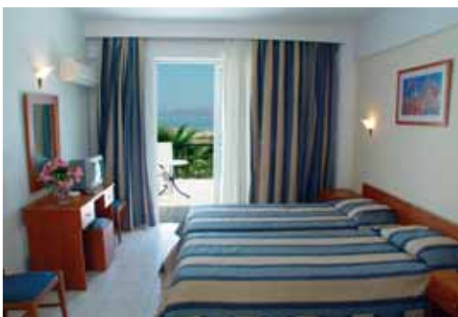
Camera Cavo D'oro