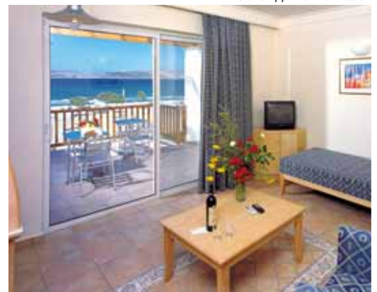
Deluxe App. Marmari Beach

Distanza dal centro surf: il Surfcenter Marmari Windsurfing dista pochi minuti a piedi.