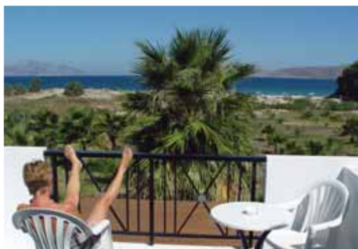
Balcone Cavo D'oro con vista mare