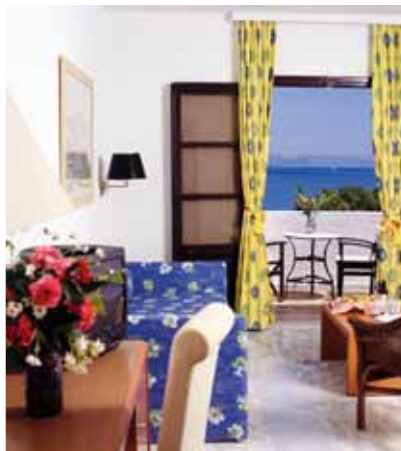
Camera hotel Oceanis

Di fianco all'Hotel Oceanis Beach Resort si trova il Grecotel Kos Imperial Thalasso, una struttura 5 stelle. Su richiesta possiamo offrirvi anche questa sistemazione.