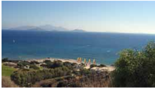
Spot Robinson Club