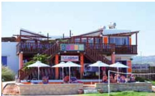
Club Mistral Gun Bay

Il Club Mistral ha 2 centri: il centro principale si trova nella Gun Bay, l'altro alla Laguna Speed. Entrambi dispongono di nuovissime tavole Mistral e Fanatic, vele North e di 2 motoscafi per la sicurezza degli ospiti; in questo modo le 2 baie sono sotto continua osservazione. Nel centro principale si trova il ristorante "Anemos" dal terrazzo del quale si gode di una vista stupenda.