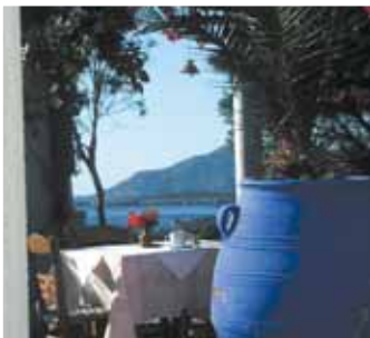
Hotel Poseidon Beach

Per info, video, prezzi dei Surfcenter visitate i nostri siti: vacanzewindsurf.com