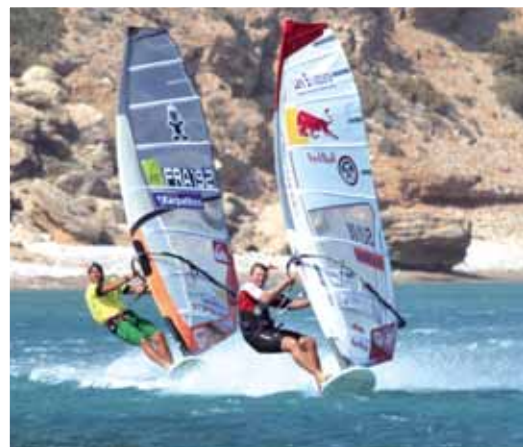
Speed World Cup 2009: Albeau e Dunkerbeck