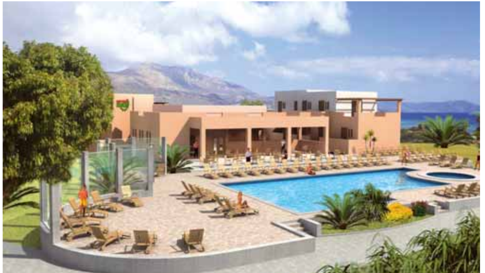
Simulazione progetto Irini Beach

Distanze circa: Paradise Bay 500 metri / Gun Bay 0 metri / Speed Lagoon 4 km / Pigadia (città) 13 km.