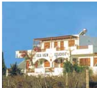
Sea View Studios