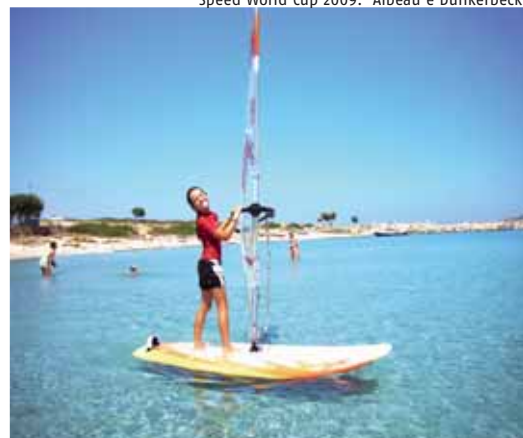
Corso principianti nella "Speed-Lagoon"