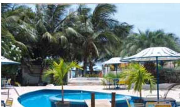
Piscina Hotel Oasis

Rimessaggio kite privato: l'Hotel Atti offre un rimessaggio kite in un box chiudibile (a poco prezzo).