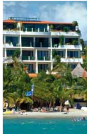
El Yaque Paradise