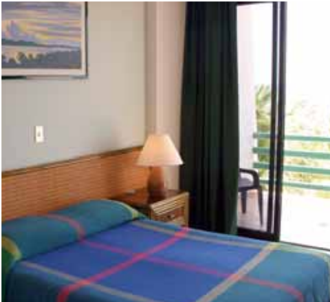
Camera El Yaque Paradise