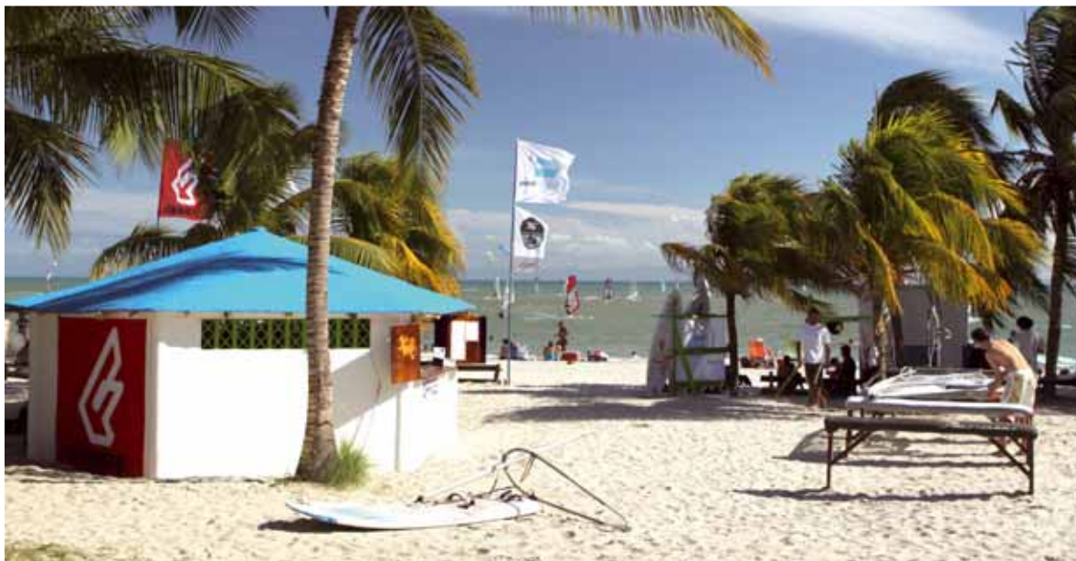
Planet Windsurfing Center