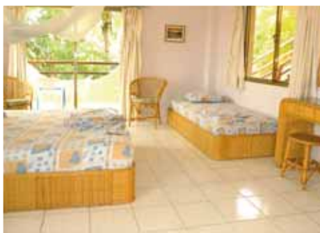
Esempio camera Hotel Atti