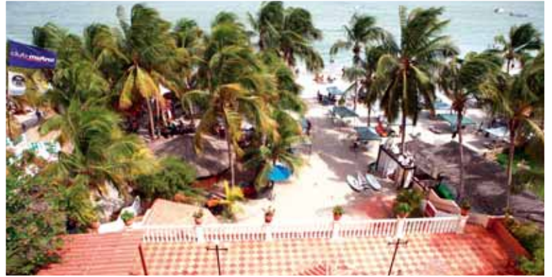
Vista dal Yaque Beach Hotel