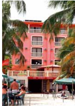
El Yaque Beach