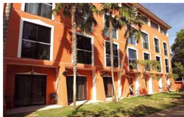
Facciata rinnovata dell'hotel Windsurf Paradise