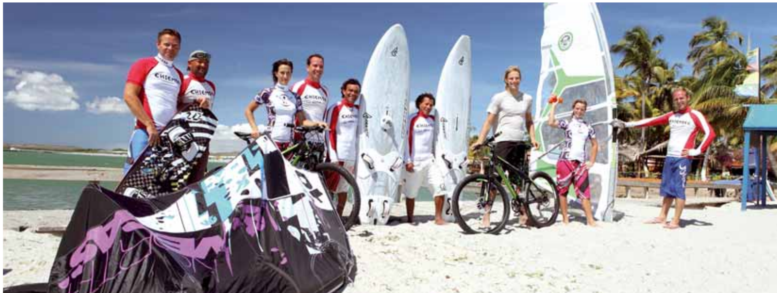
sun+fun sportclub Team El Yaque