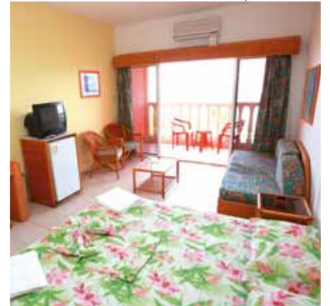
Camera El Yaque Beach