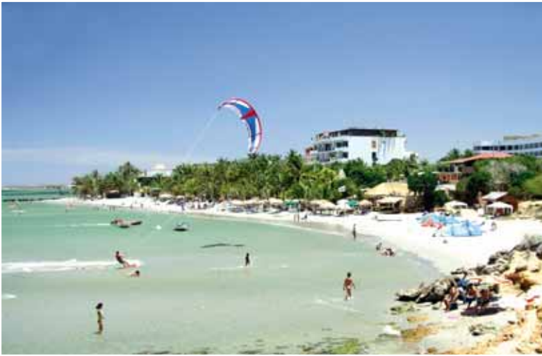
Vista verso il Yaque Paradise Hotel