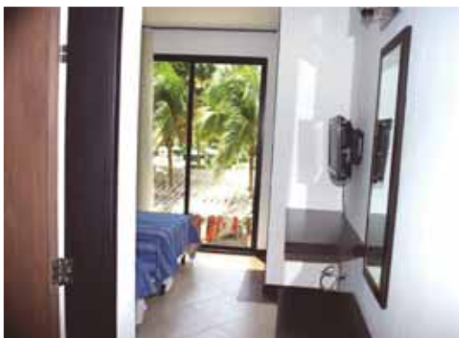
Junior-Suite con TV LCD