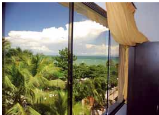
Stupenda vista dalle camere sul 3° piano