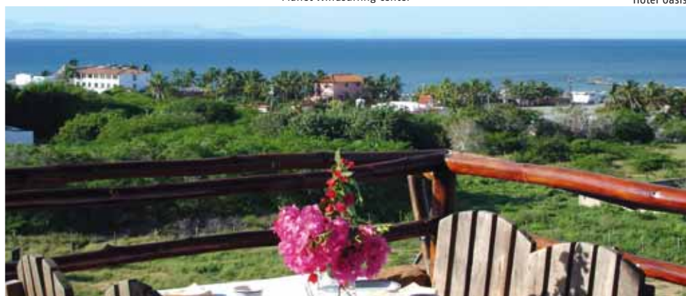
Ristorante dell'Hotel Atti

Trattamento: tra le ore 07.30 e 10.00 vi aspetta un ricco buffet per la prima colazione.