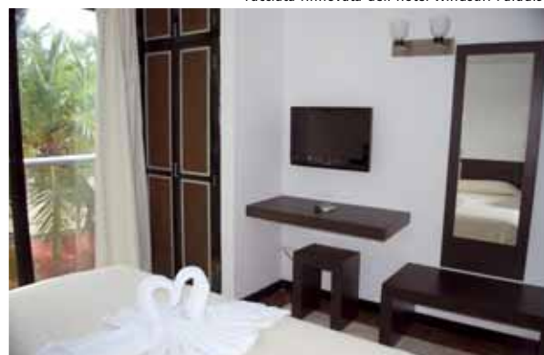
Junior-Suite con TV LCD

Per ulteriori informazioni, video e i prezzi dei vari surfcenter consultare i nostri siti vacanzewindsurf.com vacanzekitesurf.com