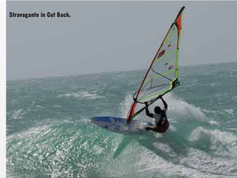
Stravagante in Cut Back.