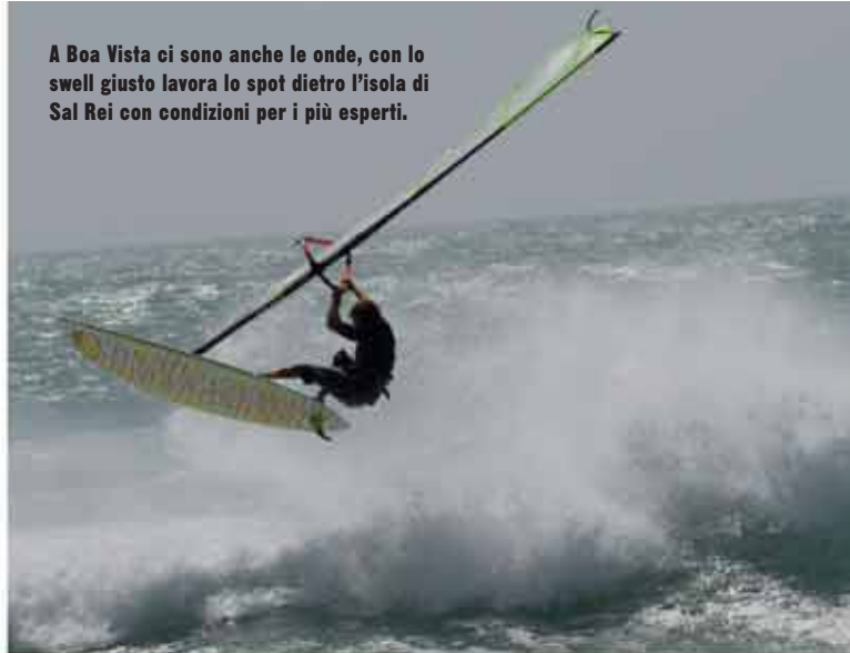
A Boa Vista ci sono anche le onde, con lo swell giusto lavora lo spot dietro l'isola di Sal Rei con condizioni per i più esperti.