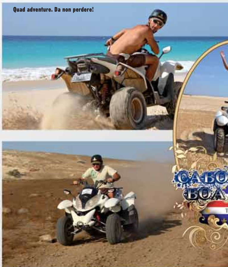
Quad adventure. Da non perdere!