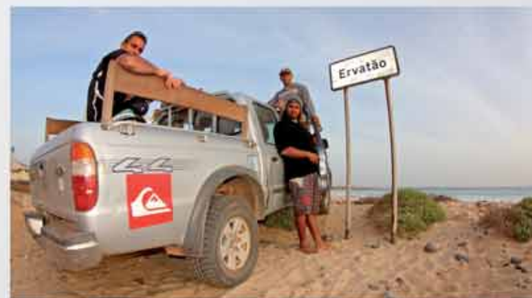
Una giornata con Stravagante: il famoso relitto e una carcassa di tartaruga; Ervatão, uno degli spot wave dell'isola; salti sulle dune di sabbia; nel fondo, reperti del relitto.