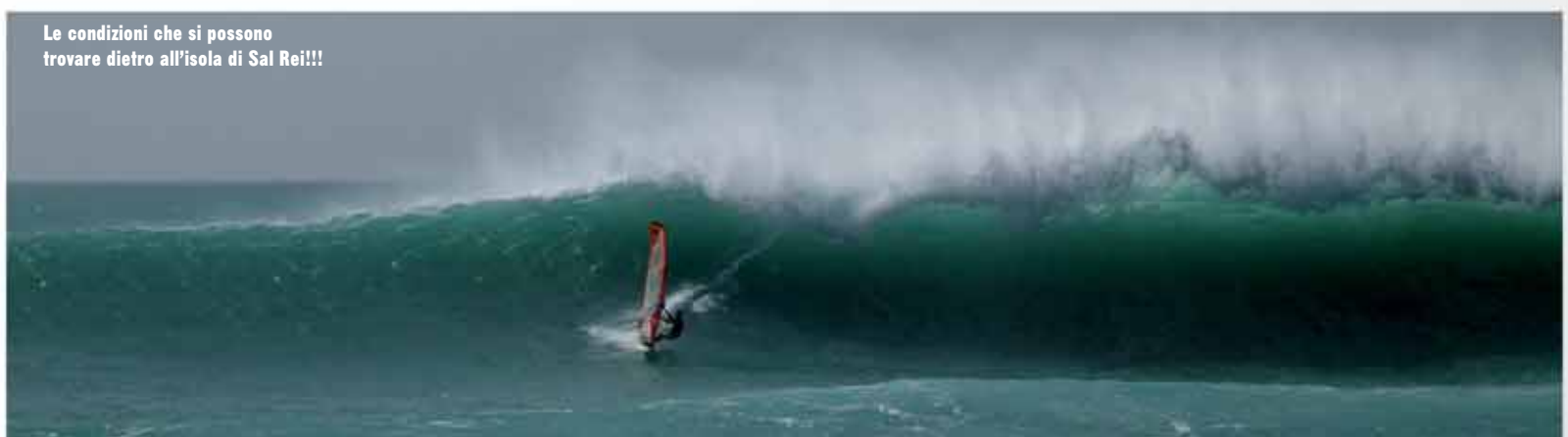
Le condizioni che si possono trovare dietro all'isola di Sal Rei!!!

TESTO DI Fabio Calò