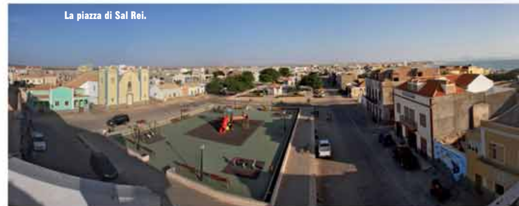
La piazza di Sal Rei.

prenotazione obbligatoria) per mangiare dell'ottimo pesce proposto in ricercati piatti dai prezzi contenuti (max 20 euro per una cena completa e con vino). Ottima l'aragosta. Se invece volete spendere ancora meno provate un posto da veri local nel container vicino al molo del porto, vi serviranno dell'ottimo pesce e spenderete meno di 10 euro. Per coloro che preferiscono mangiare nel proprio appartamento vi informiamo che i supermercati sono cari e poco riforniti, tutta la merce è di importazione e il dazio doganale è altissimo (circa 40%), conviene andare fuori a cena. Nei vari ristoranti degli alberghi che abbiamo provato si mangia discretamente. • QUAD: Non perdetevi una giornata con i quad per esplorare l'isola, potrete andare nel deserto, sulle lunghissime spiagge e addentrarvi all'interno dell'isola. Vivamente consigliato. Per info: Quad Land, tel +238.9946139, e-mail: info@quadland-boavista.com, web: www.quadland-boavista.com • NIGHTLIFE: La vita notturna è decisamente tranquilla durante la settimana. Ci sono due pub sulla piazza principale, entrambi gestiti da italiani, noi vi consigliamo il Makena. I local tendono comunque ad uscire tardi, dopo le 24.00.