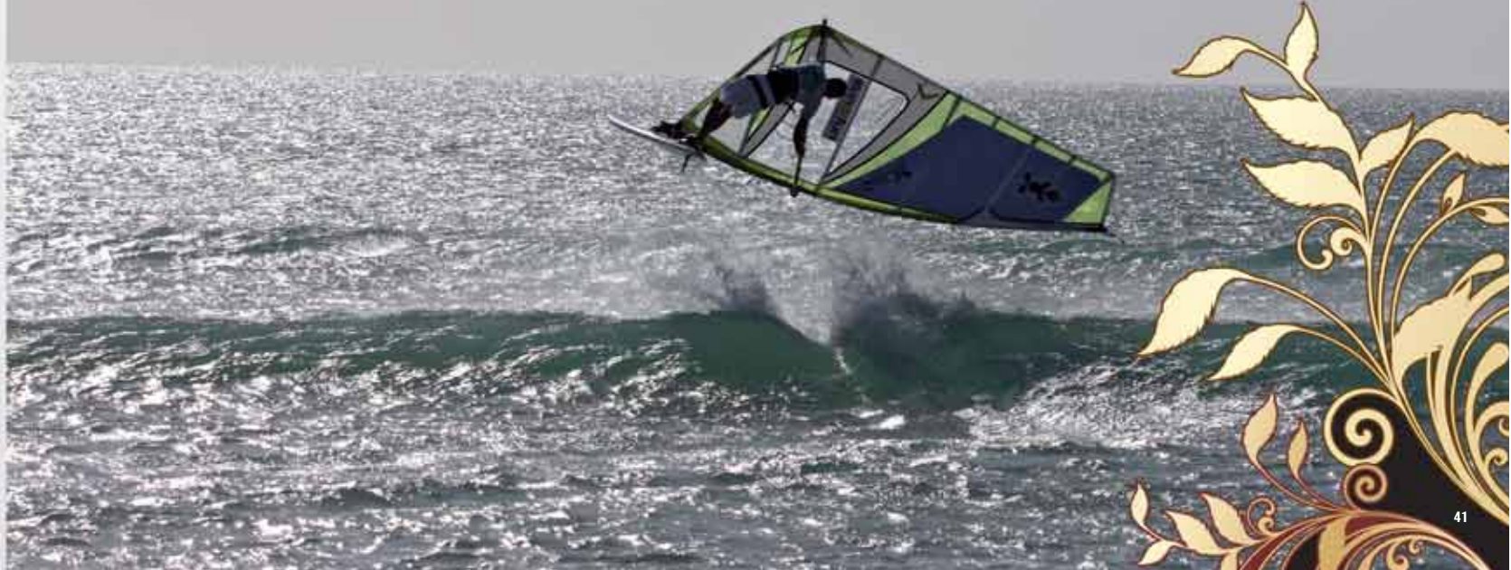
Ogni tanto, anche quando lo swell non è attivo, entrano nella laguna di Turtle Bay divertenti onde da saltare e surfare con il vento off-shore.