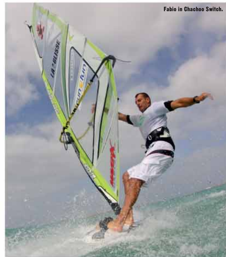
Fabio in Chachoo Switch.

• WAVE SPOT: Boa Vista è anche adatta agli esperti del wave. Con swell da sud si creano onde gigantesche, dietro l'isola di Sal Rei, con condizioni simili a quelle di Ponta Preta, ovvero onde enormi con vento off-shore. Se avete invece voglia di muovervi con la macchina potete andare a vedere le onde nella parte nord dell'isola dove c'è il relitto, condizioni on-shore. Oppure spostarvi nella parte sud-est negli spot di Curral Velho e Ervatao, quest'ultimo può offrire ottime condizioni di onda con vento side. Noi purtroppo non li abbiamo visti funzionare, ma dalle foto e dai racconti dei local possiamo intuire la potenzialità di questi spot. Distanza circa 50-90 minuti di macchina da Sal Rei.