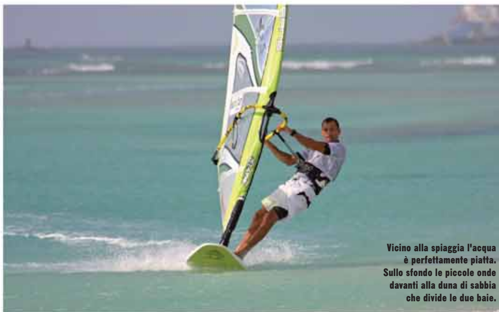
Vicino alla spiaggia l'acqua è perfettamente piatta. Sullo sfondo le piccole onde davanti alla duna di sabbia che divide le due baie.