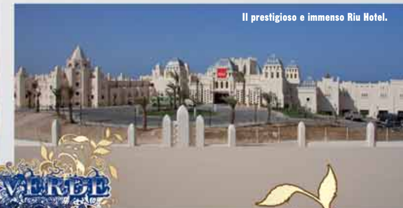
Il prestigioso e immenso Riu Hotel.