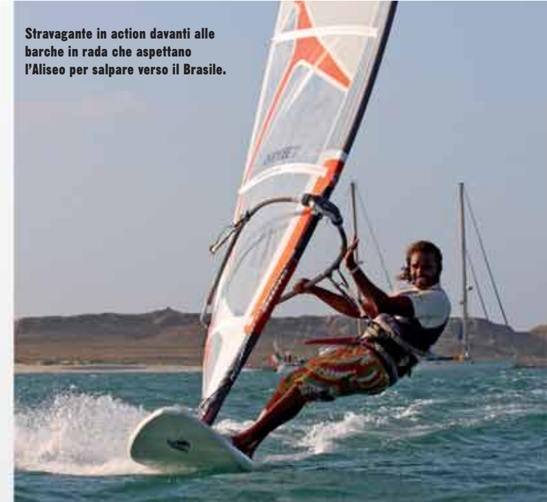
Stravagante in action davanti alle barche in rada che aspettano l'Aliseo per salpare verso il Brasile.

tocca per almeno 100 metri. Il vento soffia da terra e leggermente da destra. Si consiglia l'utilizzo di scarpette, soprattutto per i principianti, perché il fondale dove si tocca è ricoperto da un reef spugnoso.